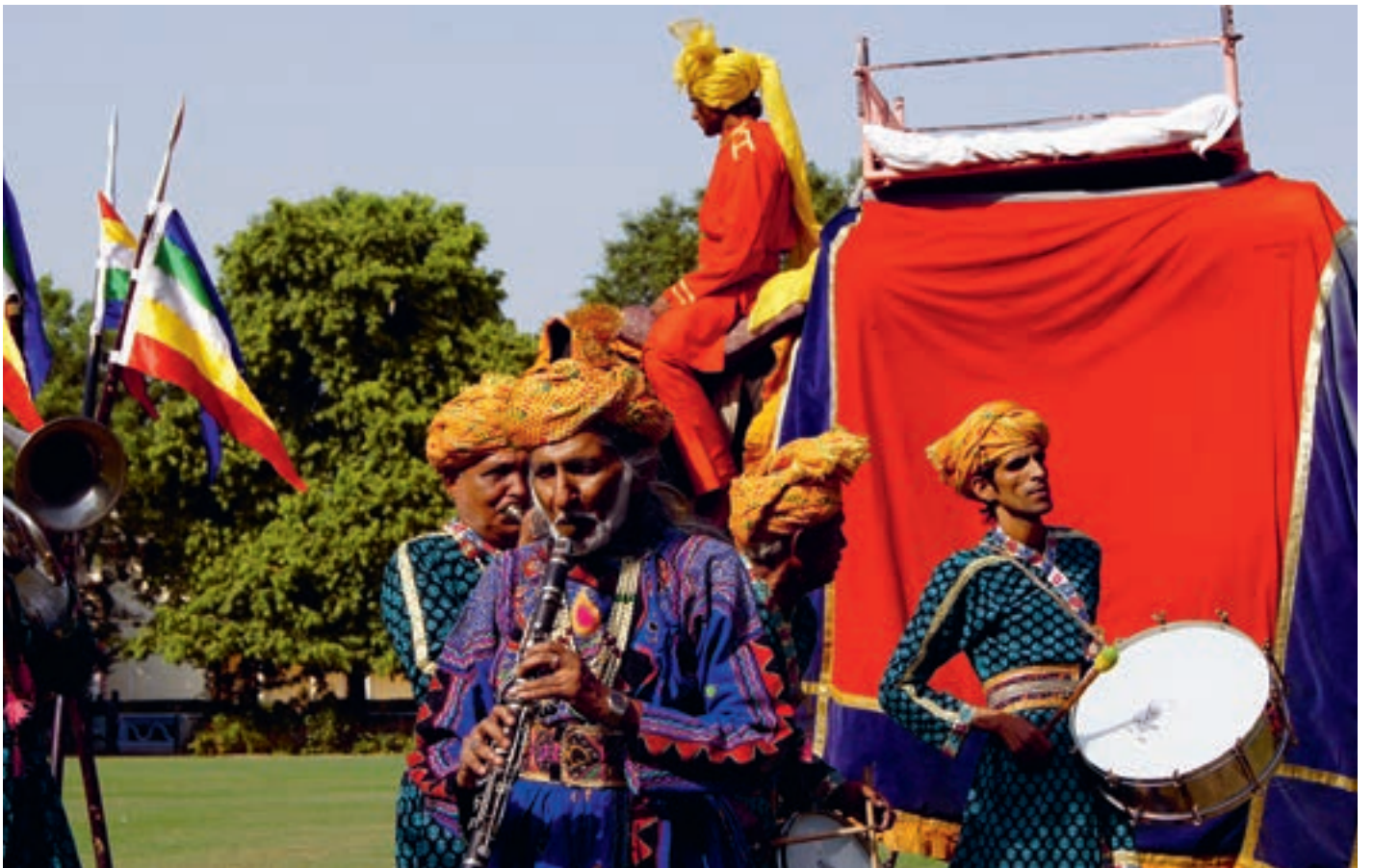
Джайпур. Оркестр и погонщики слонов