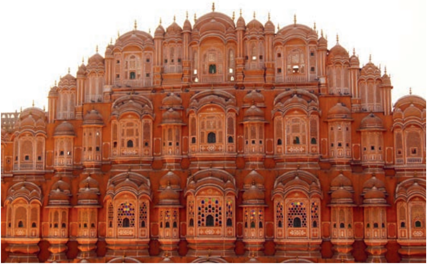
Джайпур – розовый город