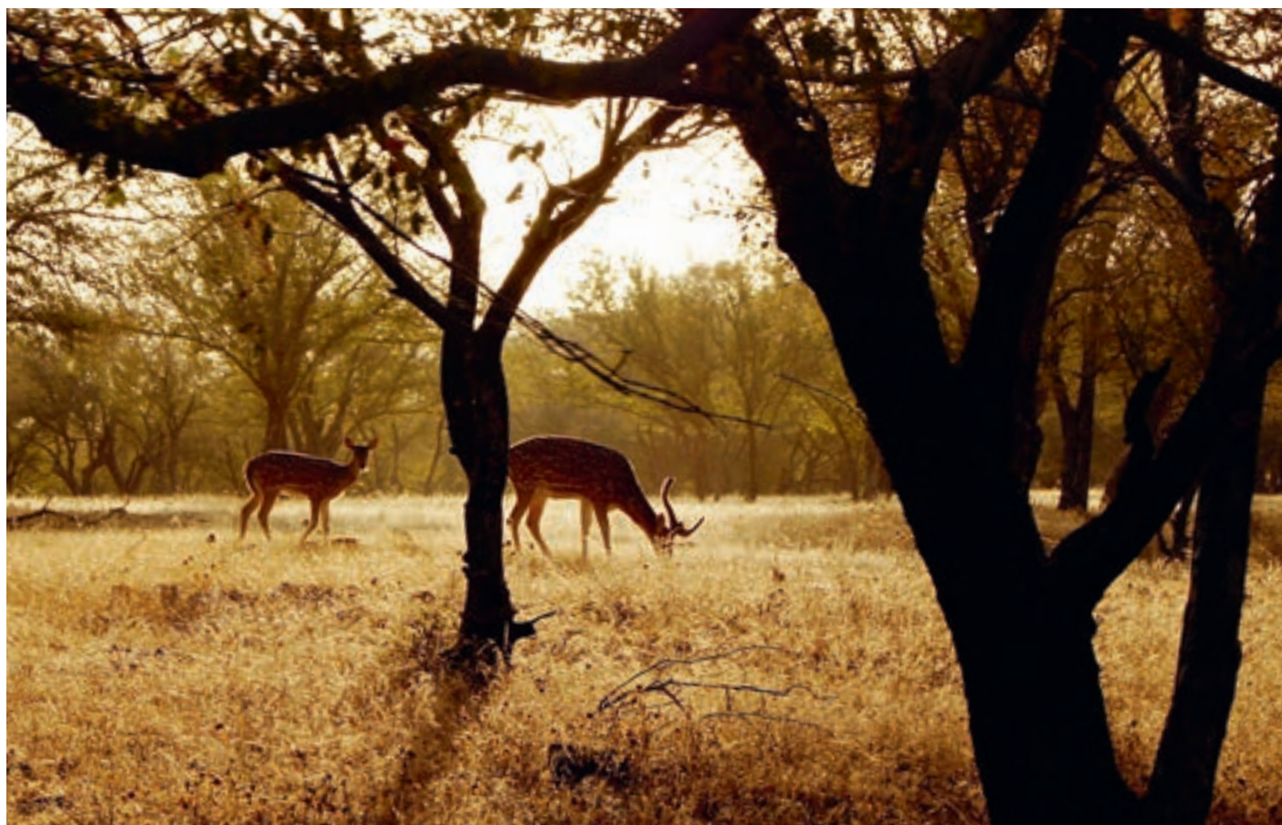
Национальный парк «Рантхамбор»