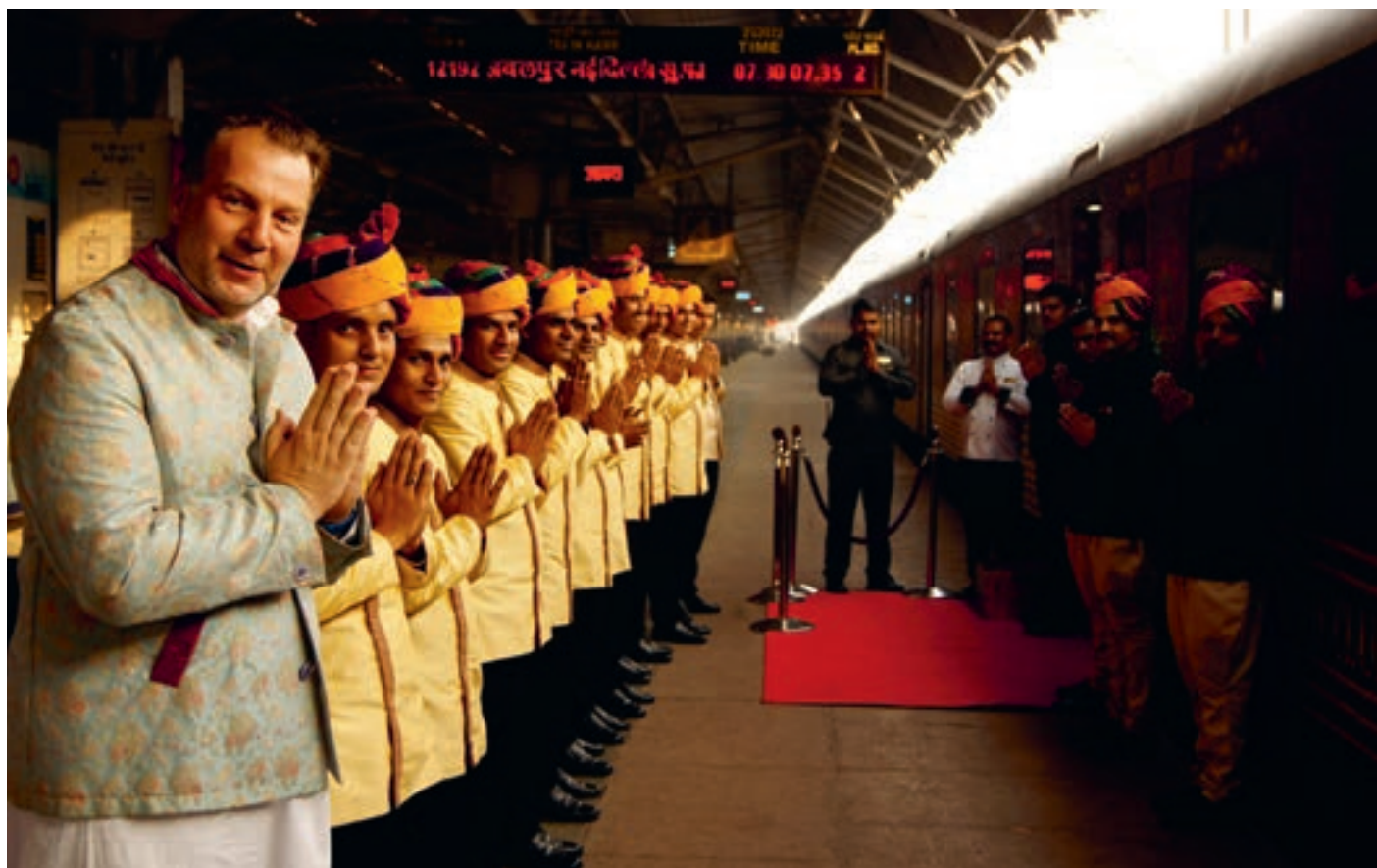
Дели. Вокзал «Махараджа-экспресс»